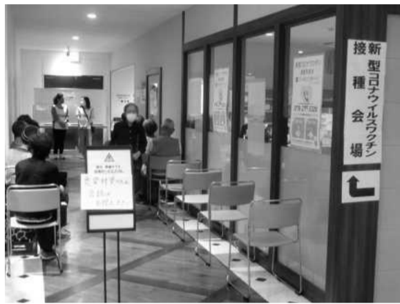
予約時の大混乱を経つつようやく高齢者へのワクチン接種も進み出した=5月28日、神戸市中央区

またも緊急事態宣言の延長だ。菅首相は、5月末までを期限としていた兵庫県など9都道府県への緊急事態宣言を6月20日まで延長した。兵庫県などの4都府県にとっては5月12日の延長に比べ再延長で、業種によってはほぼ2カ月にわたって休業要請を受けることになり、まさに死活問題だ。政権の見通しの甘さ、発信の説得力の乏しさが今回も露呈した格好だが、すでに置き換わったとされるイギリス型変異株よりもさらに感染力の強いインド型変異株が広がろうとしている感染状況を考えれば宣言の延長もやむを得まい。