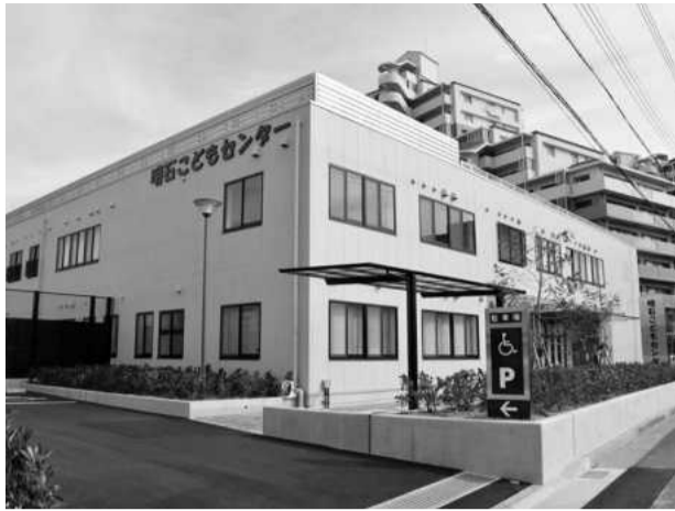
2019年4月に開所した明石子どもセンター

2018年4月に中核市に移行した明石市は、泉市長が「子どもを核としたまちづくり」を掲げ、2013年7月から中学生までの医療費の無料化、2016年9月から第2子以降の保育料無料化など、子どものための先進的な諸施策を実施している。